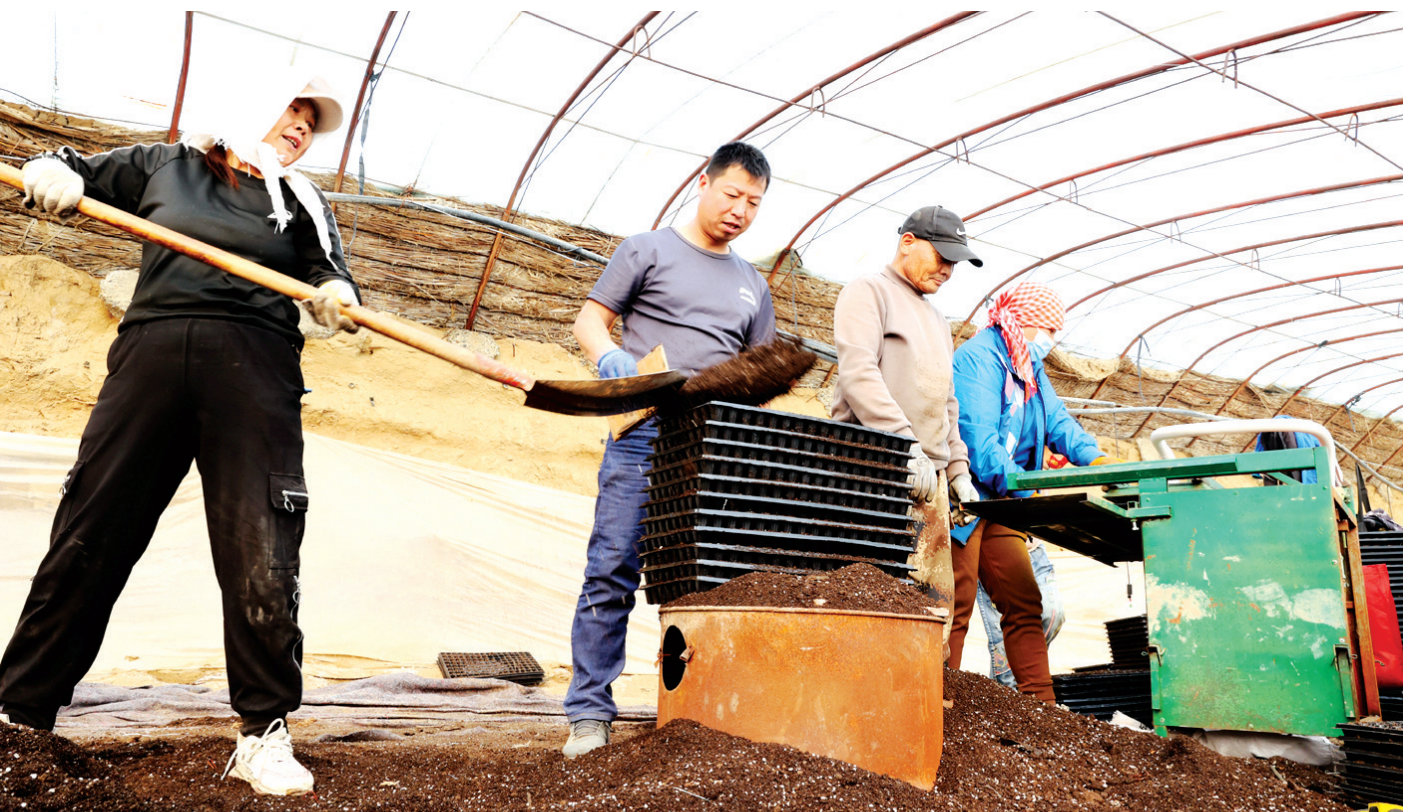
2月26日，昌吉市二六工镇下六村蔬菜育苗基地里，种植户正在育苗蔬菜培养土。

前途一片光明，舞台无比广阔，奋斗正当其时。让我们更加紧密地团结在以习近平同志为核心的党中央周围，坚持不懈用习近平新时代中国特色社会主义思想武装头脑，深刻领悟“两个确立”的决定性意义，坚决做到“两个维护”，不断筑牢信仰之基、补足精神之钙、把稳思想之舵，在直面问题、破解难题中不断打开工作新局面，为推进中国式现代化作出新贡献。